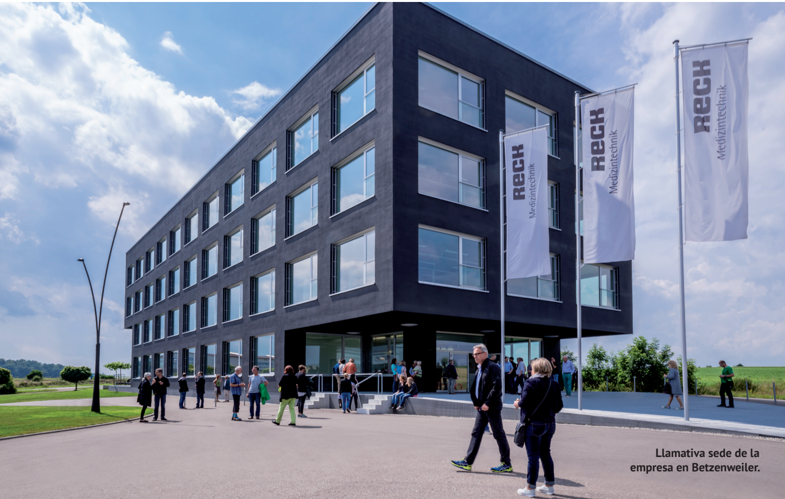
Llamativa sede de la empresa en Betzenweiler.